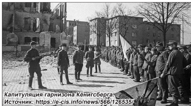
Капитуляция гарнизона Кёнигсберга.

Когда мне вручили орден Красной Звезды, я был автоматчиком. Во время боя командир взвода отдал приказ – в плен немцев не брать, уничтожать на месте. За годы войны у нас накопилась большая злость к врагу, хотелось отомстить за Родину. Мы строчили по фашистам. (Продолжение на стр. 8.)