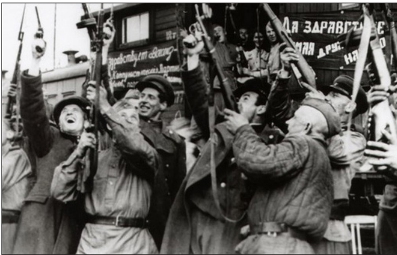
Салют Победе! 1945 г. Источник: https://sun3-13.userapi.com .

Фото на стр. 1 с сайта https://cdn.culture.ru .